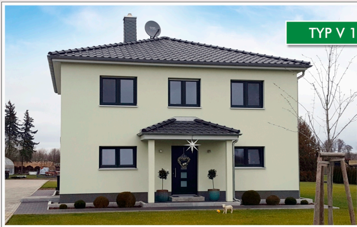
TYP V 147